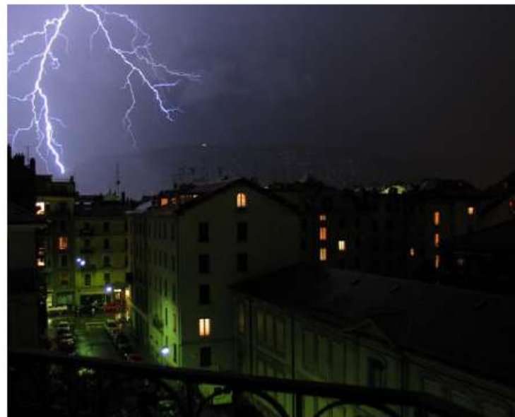
■ Après ces fortes chaleurs, les premiers orages se sont manifestés ce mercredi en fin de journée à Bertrix.