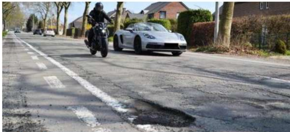
Des portions de routes en mauvais état depuis longtemps.

Le chantier doit durer sept jours, jusqu'au 28 juin, sous réserve des conditions météorologiques. On évoque principalement un raclage de la chaussée