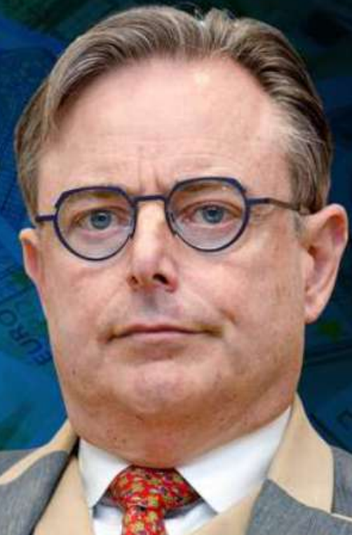
Le Premier ministre, Bart De Wever, n'a pas apprécié un retard qui a coûté cher à son gouvernement.