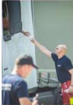
Des bouteilles d'eau

La protection civile et la zone Hainaut-Centre ont distribué des bouteilles d'eau aux automobilistes coincés dans d'importants bouchons sur l'E42, à hauteur de La Louvière, après l'accident d'un camion survenu la veille. Le plan communal d'urgence a été mis en pré-alerte.