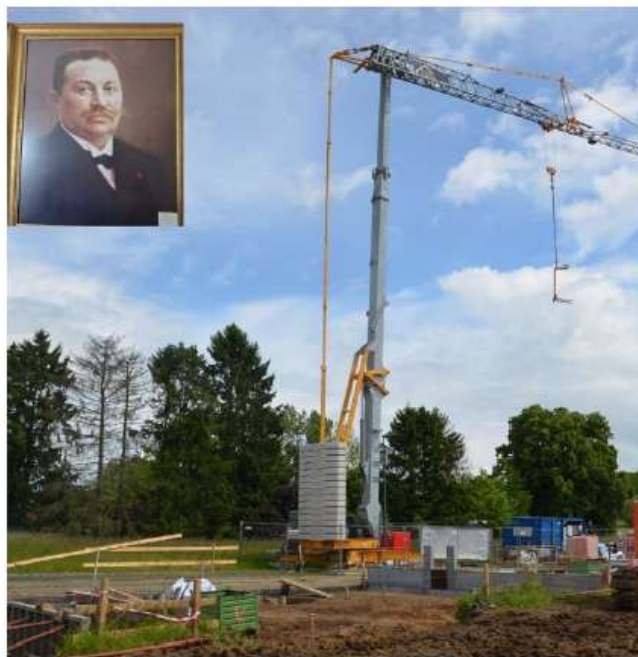
■ Les travaux ont débuté au sein de la ZACC Belle-Eau.