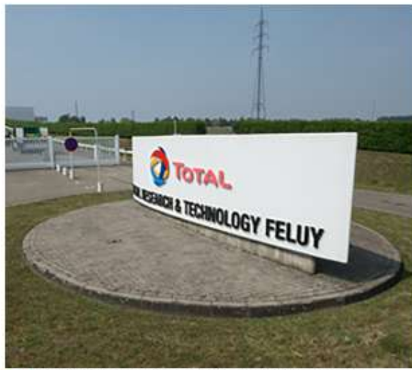
■ Le dossier TotalEnergies continue de faire des remous.