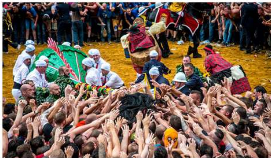
■ Arracher le crin du dragon n'est possible que grâce à un précieux savoir-faire.

Pour faire face, l'idée de teindre du crin a déjà été étudiée, mais les quantités de produit nécessaires rendraient l'opération bien trop coûteuse. Chaque année, les équipes doivent donc relever un véritable défi pour permettre au dragon d'entrer une nouvelle fois dans l'arène... avant que sa queue ne soit prise d'assaut par des milliers de mains tendues. Comme ce sera le cas dimanche.