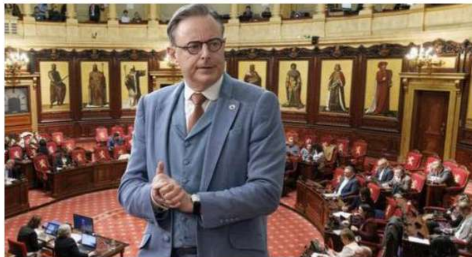
Bart De Wever qualifie le Sénat de « symbole du gaspillage de l'argent public ».

Alors, chacun avance évidemment ses arguments. Mais sur le fond, Bart De Wever a-t-il tort ? Les grands sujets de société et éthiques nécessitent en effet des débats plus apaisés, une recherche d'un certain consensus... Aussi noble et essentielle soit la requête des socialistes francophones, qui plus est dans une Belgique qui peut s'enorgueillir d'être en avance sur ces questions, faut-il en