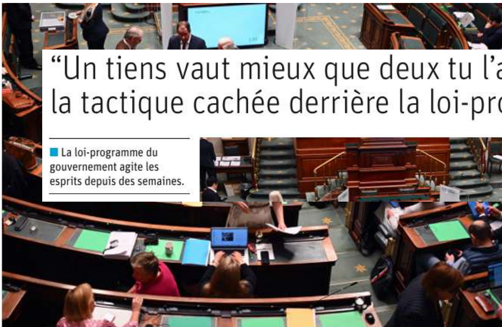
La Chambre lors de l'une de ses sessions plénières. Ce jeudi, la majorité Arizona réussira-t-elle à faire passer sa loi-programme ?

■ La loi-programme du gouvernement agite les esprits depuis des semaines.