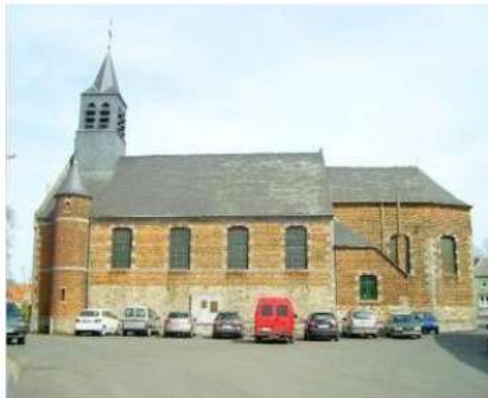
A ceux qui n'ont jamais pénétré dans l'édifice : c'est l'occasion!

Située place René Anème à Leval-Trahegnies, l'église Saint-Pierre occupe une place particulière dans l'histoire du village. Au fil des siècles, Leval a subi de nombreux dégâts lors des guerres qui ont visé la place forte de Binche. C'est dans ce contexte que l'édifice religieux fut reconstruit en 1776 par les chanoines du chapitre Saint-Ursmer.