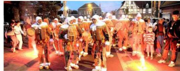
Un ramassage folklorique est difficile à sécuriser totalement © B.L. Photo prétexte

Ce mardi, à la lumière des témoignages des responsables de la sécurité lors des ramassages des carnivals, la sécurisation du ramassage de Strépy (mais aussi d'autres carnivals) est mise sur la sellette.