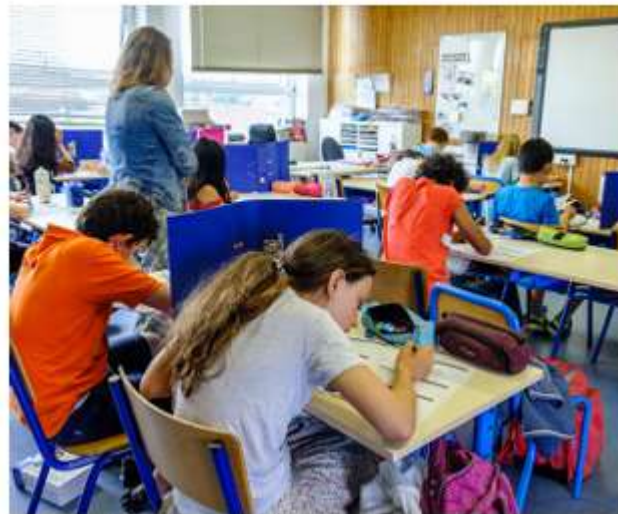
Les nombreux jours de grève perturbent la préparation aux examens de fin d'année.

Certaines écoles ont déjà communiqué l'annulation