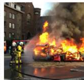
Les pompiers de Leuze en démonstration.