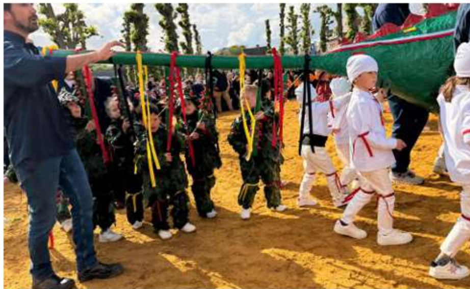
Le Doudou s'invite aussi dans les écoles de Mons.

Enfin, il y a le traditionnel “Doudou en Couleurs”, auquel participent quasiment toutes les écoles communales. Plus de 1000 enfants y réalisent des dessins autour du folklore montois. Pour Argyro Gyparakis, ces projets vont bien au-delà du simple bricolage. “Certains s'étalent sur plusieurs mois et permettent une vraie transversalité entre les matières : lecture, expression orale, activités artistiques...” Une manière, aussi, de faire vivre le folklore montois bien au-delà du seul week-end de la Trinité.