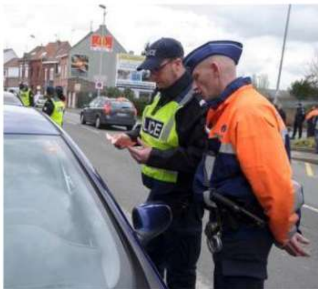
La police ne chôme pas !

« En 2025, la police a comptabilisé 2.245 infractions impliquant des conducteurs âgés de moins de 18 ans n'ayant pas le permis, contre 1.860 en 2024, 1.612 en 2023 », détaille Belinda Demattia, porte-parole de l'Agence wallonne pour la sécurité routière. Avant le Covid, les chiffres variaient entre 987 et 1.182. À cela, il faut ajouter 5 verbalisations de mineurs sans permis valide en 2025 et trois sous le coup d'une déchéance. « On peut être condamné à une dé-