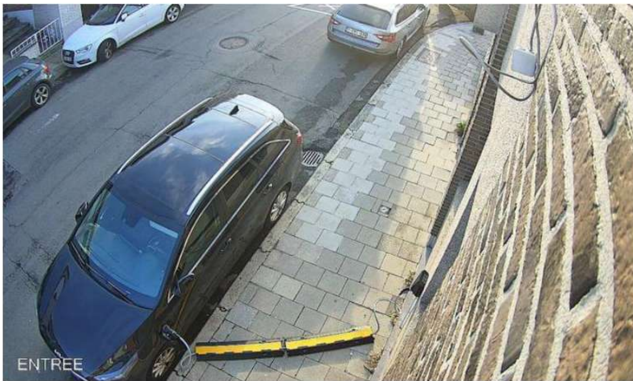
La voiture du Sérésien à l'époque où on l'autorisait à recharger devant chez lui (avec une goulotte de protection sur le trottoir).

D'autres ne légifèrent pas et préfèrent en rester à l'interdiction pure et dure. C'est le cas de la ville de Seraing, où un arrêt du conseil d'État, publié la semaine dernière, nous apprend qu'un particulier a été mis en demeure. La commune lui ordonne de retirer la goulotte de protection qui lui permettait de faire passer ses câbles sur le trottoir jusqu'à la borne fixée sur sa façade et lui interdit aussi