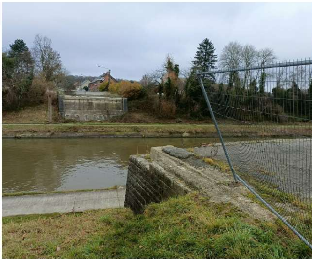
■ La pétition se clôture le 19 juin.