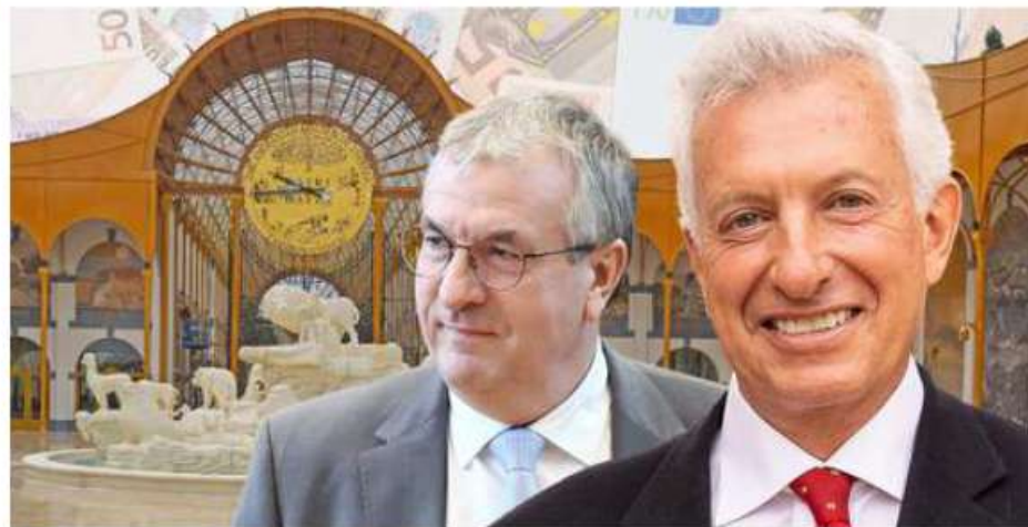
Ces 11,5 millions étaient pourtant bien légaux.

Le futur parc aquatique reste donc bien sur les rails. Éric Domb le présente comme « une nouvelle expression » du projet développé depuis plus de trente ans à Brugelette. « Depuis plus de trente ans, Pairi Daiza construit en Wallonie un projet fondé sur une conviction simple : la nature, la beauté et l'émerveillement peuvent devenir une force de développement durable pour toute une région », conclut-il. ■