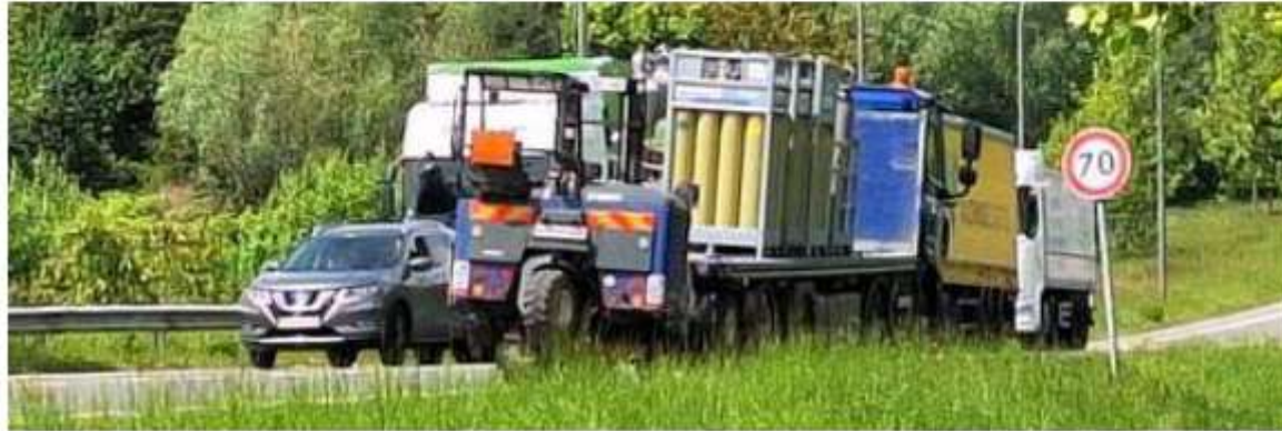
Une ambulance s'est rendue sur les lieux.