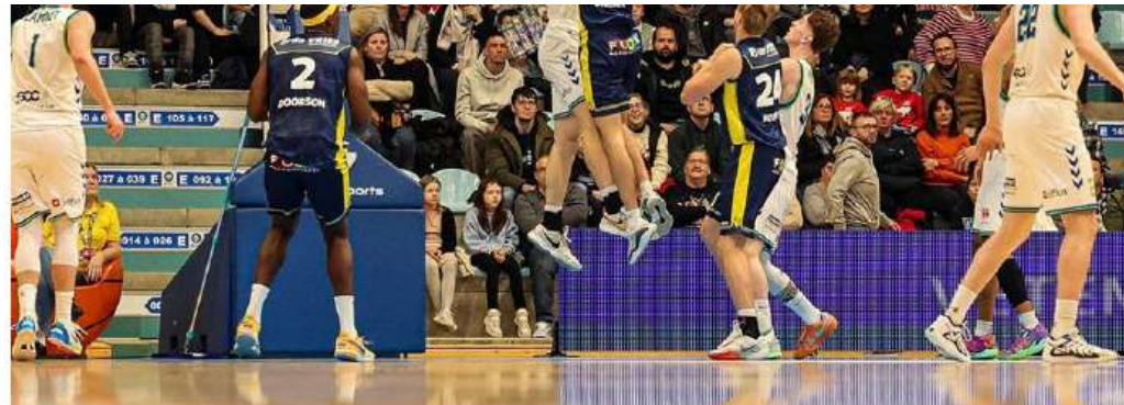
■ La ville de Mons souhaite sauver son club de basket.