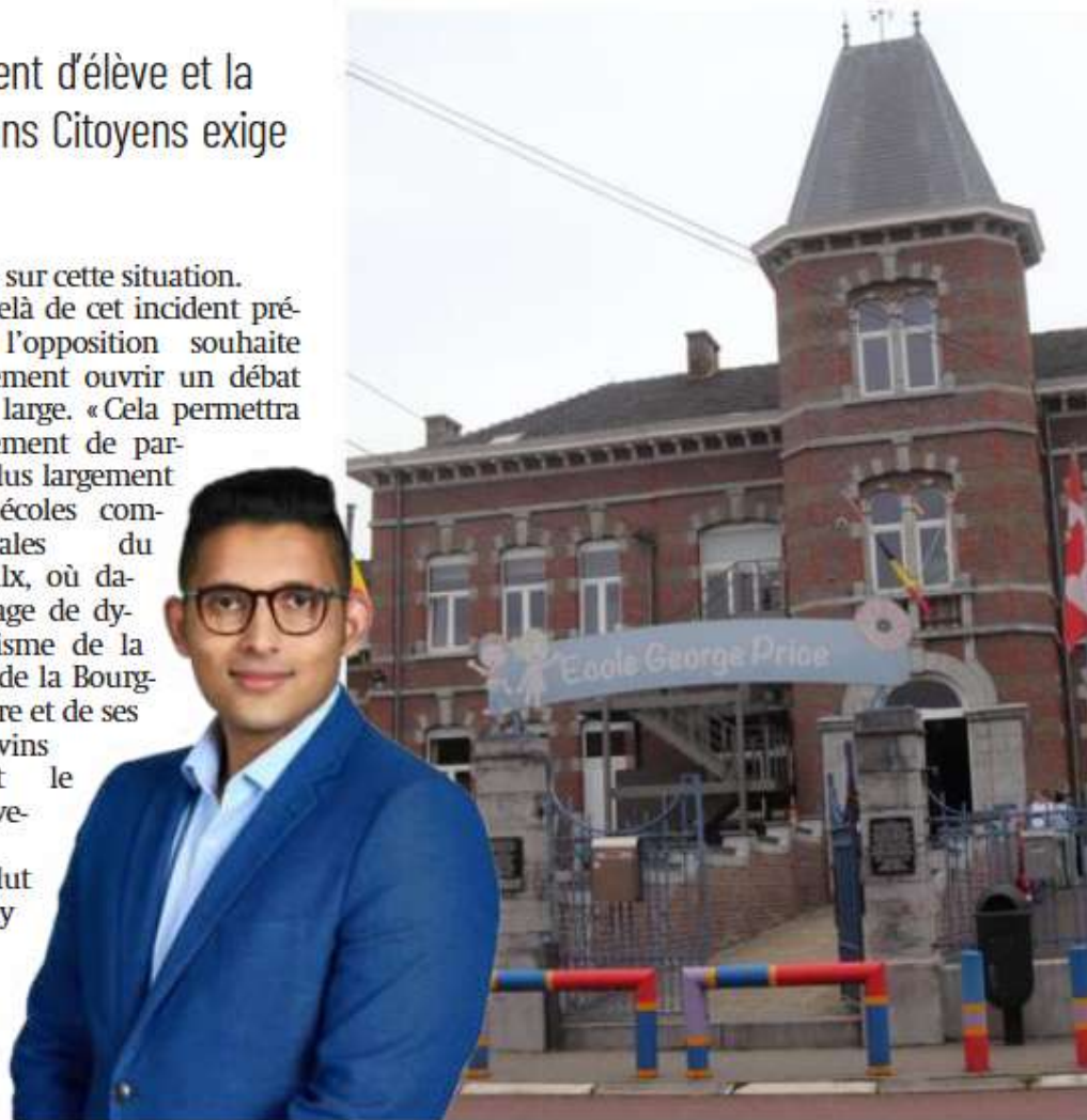
Lenny Ferretti a déposé un point à l'ordre du jour du prochain conseil.