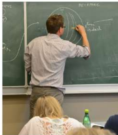
Le jugement du Tribunal confirme la position du SLFP Enseignement.

Pour pouvoir avoir une DPPR – qui permet de réduire ou d'arrêter ses prestations avant l'âge de la retraite – il faut se référer à la date P (première date de pension commune que le membre du personnel peut prendre) qui figure sur le site du SFP. “Ce sont justement ces dates-là qui avaient disparu chez certains affiliés, qui n'obtenaient donc