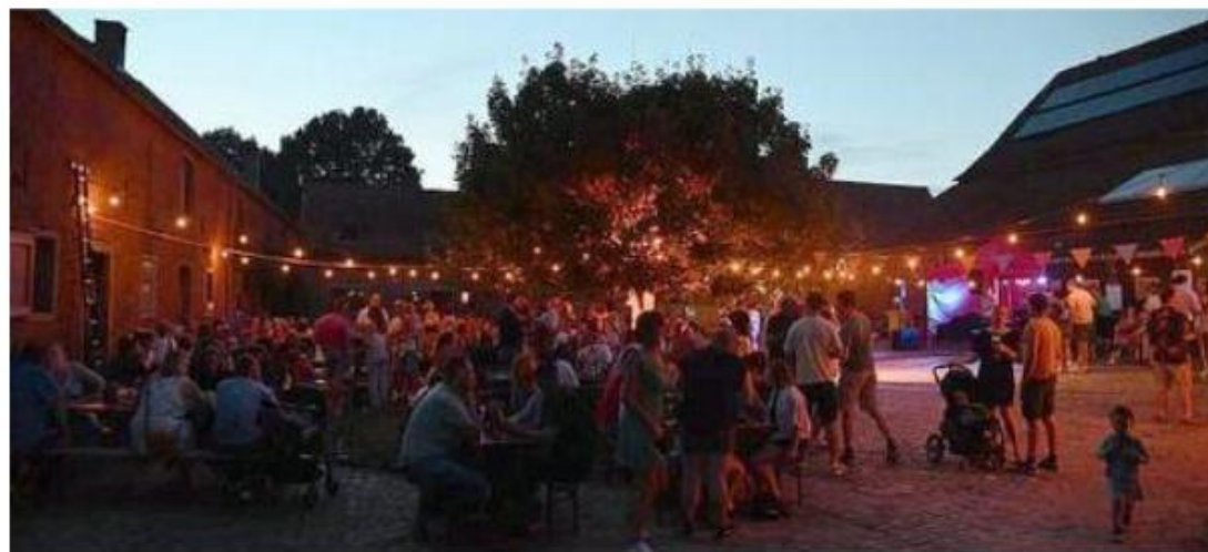
La Guinguette mêle animations pour enfants, restauration locale et musique au cœur de la campagne.

L'entrée sera fixée à 3 euros en prévente et à 4 euros sur place pour les personnes de plus de 16 ans. L'accès restera gratuit pour les enfants. Les organisateurs ex-