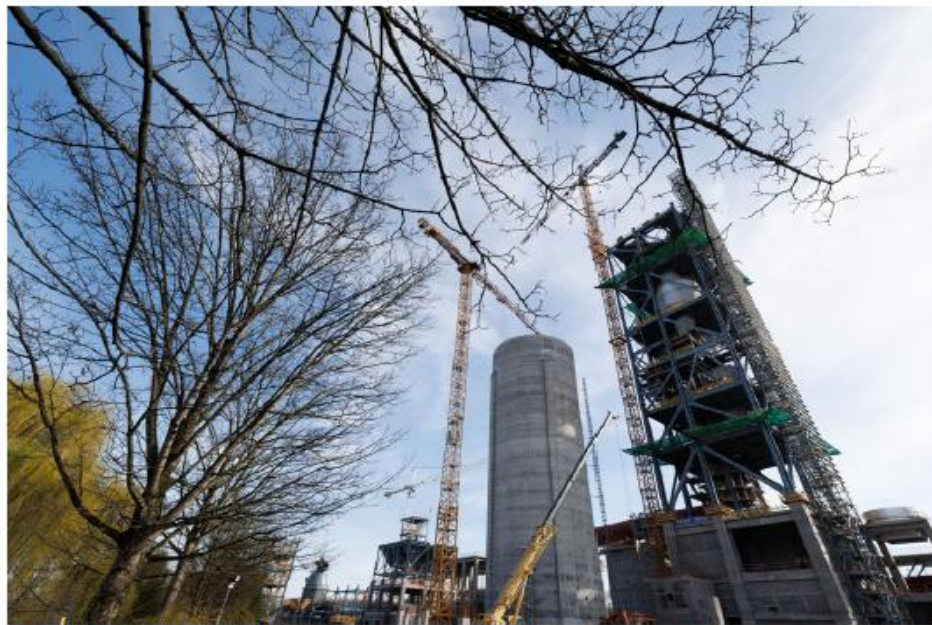
■ Holcim poursuit ses projets, mais pour la ville de Mons, pas question de dire oui à tout.

"L'impact serait majeur, c'est totalement excessif. Nous soutenons le développement des énergies renouvelables et la nécessité d'accélérer la transition énergétique mais pas à n'importe quel prix. Notre beffroi, inscrit au patrimoine mondial de l'Unesco, constitue un repère emblématique du paysage montois et sa prépondérance visuelle doit être préservée." D'autant que cette dernière est déjà mise à mal par la construction d'une tour haute de 140 mètres, soit 1,5 fois le beffroi.