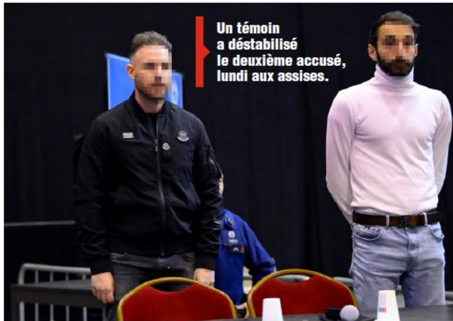
Un témoin a déstabilisé le deuxième accusé, lundi aux assises.