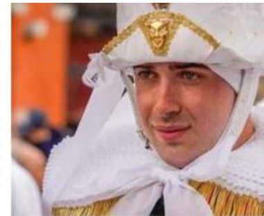
Les Récalcitrants : un nom qui traduit l'état d'esprit des membres de la société.