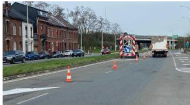
Des travaux ont lieu entre Mons et Casteau.

Le tronçon entre le carrefour de la Violette (non compris) et l'échangeur E42-E19/A7 sera traité du mardi 26 mai au vendredi 5 juin, en deux phases. Du mardi 26 mai au vendredi