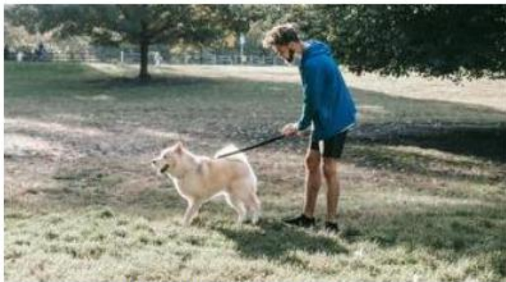
Les toutous seront tenus en laisse.

Une balade canine groupée sera également organisée dès 9h30 sur un parcours de 3 kilomètres avec la participation de Yana – Éducation canine, une éducatrice canine professionnelle qui accompagnera les participants et leurs chiens durant la promenade.