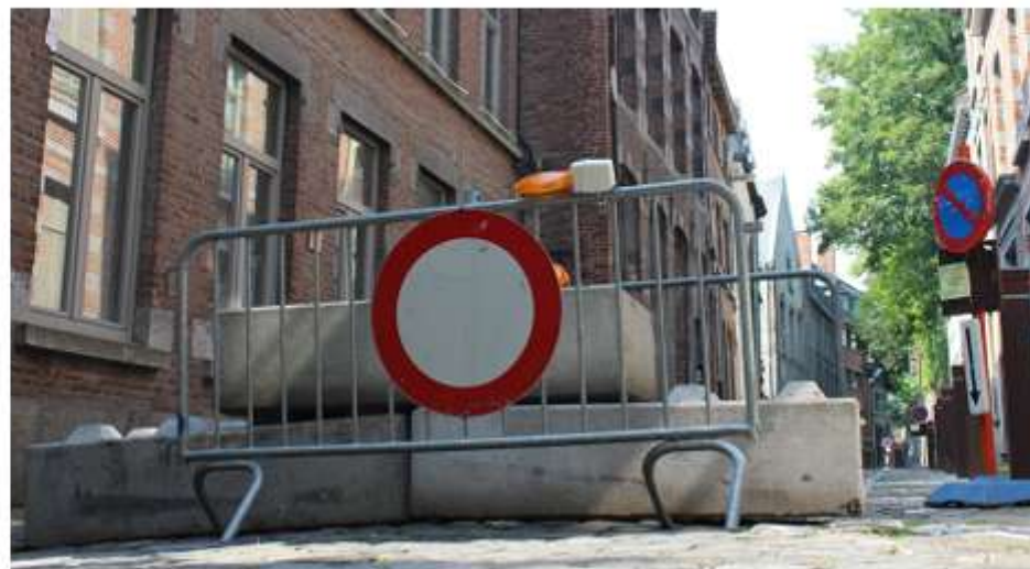
■ Rues fermées, stationnement interdit sont la norme en centre-ville lors des festivités.

À ce stade, aucune nouvelle procédure spécifique n'est annoncée pour faciliter l'accès des soignants pendant les événements. La Ville reconnaît la difficulté rencontrée par certains professionnels, mais estime que l'équilibre entre continuité des soins et sécurité publique reste particulièrement délicat à atteindre.