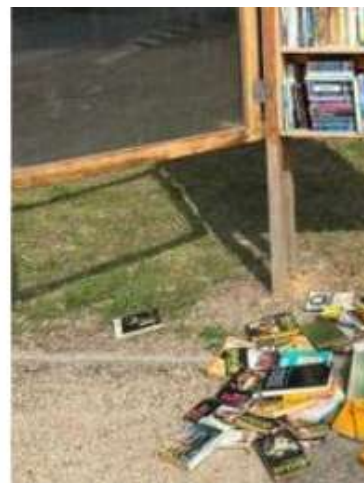
Un triste spectacle.

L'identification des auteurs reste pour l'instant incertaine. « Jusqu'à présent, nous ne savons pas