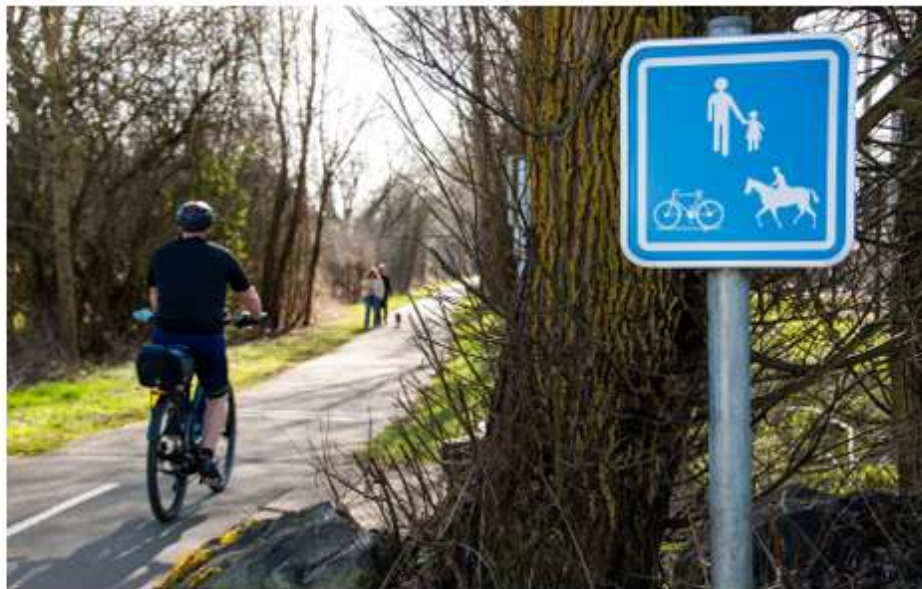
Le Ravel permettra de relier La Louvière à Soignies en passant par le Rœulx.