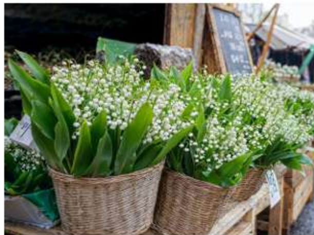
Le muguet fleurit de plus en plus tôt, et cela perturbe tout le secteur.

Cette année, les prix resteront relativement accessibles. "Je vais vendre le brin entre 1,50 € et 1,75 €, et le petit bouquet entre 3,50 € et 4 €. On reste très proches des prix des grandes surfaces, mais avec une qualité et un soin incomparables. Il ne faut pas oublier qu'il y a plusieurs catégories de muguet sur le marché."