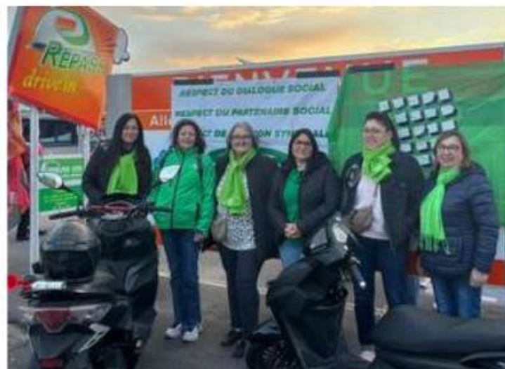
Plusieurs revendications sont portées par le personnel.

Les syndicats dénoncent également une dégradation des conditions au sein d'une structure censée relever de l'économie sociale. « La manière dont les travailleurs sont considérés n'est pas digne d'une telle entreprise », estiment-ils. Une rencontre entre la direction et l'ensemble du personnel est récla-