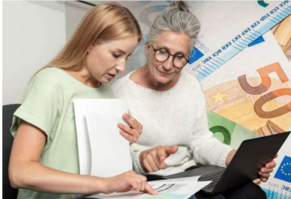
La saison de la déclaration d'impôt des personnes physiques est lancée.

> Calendrier inchangé. Les déclarations papier doivent toujours être rentrées pour le 30 juin. Cette date est aussi celle qui concerne les modifications des propositions de déclaration simplifiée. Pour les déclarations en ligne, sans revenus spécifiques (revenus d'indépen-