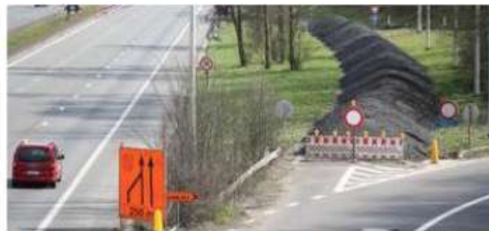
Le prix du bitume a explosé en un mois.

Bonne nouvelle en revanche pour les communes et les petites réparations du quotidien : reboucher un nid-de-poule ne coûtera pas beaucoup plus cher. Pourquoi ? Parce que, dans ce type d'intervention, la matière