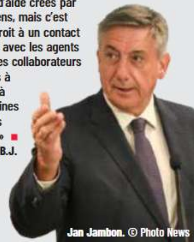
Jan Jambon.