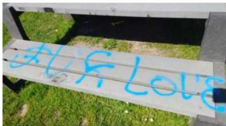
La commune a porté plainte.

En attendant, les services communaux sont mobilisés. « On va réparer, nettoyer, prendre les mesures de précaution », assure l'échevin. « J'ai demandé qu'on vide la boîte à livres temporairement car les livres ont servi de combustible. Néanmoins, les services communaux ne peuvent pas tout et ne sont pas en mesure de réparer le revêtement d'une zone dédiée au sport. » Le remplacement complet n'est pas exclu : « Il faudra faire appel à une entreprise spécialisée pour voir ce qu'on peut faire et on avisera. » ■ V.P.