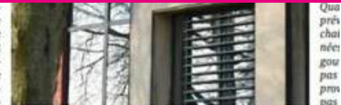
« Ce s'annonce compliqué pour les CPAS... »

dant d'une part à devoir gérer un plus grand nombre de dossiers avec la réforme du chômage et comptant d'autre part sur des aides financières du fédéral, le CPAS de Frameries a demandé au CRAC l'autorisation d'engager du person-