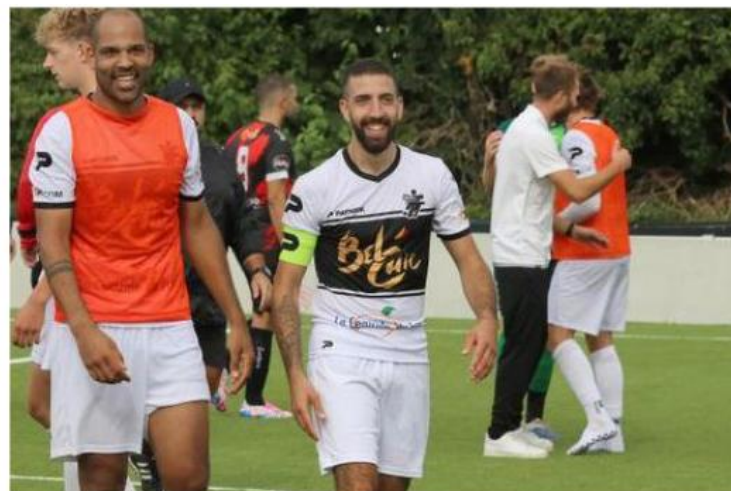
Un capitaine confiant pour l'ultime journée.

fait deux semaines que nous sommes un peu moins bien dans le jeu. Ce n'est pas le stress, plutôt la fatigue. La saison est longue, et rester en tête aussi longtemps use mentalement. » Dans le même temps, Montignies affrontera Molenbaix et compte bien jouer son rôle d'arbitre dans la course au titre jusqu'au bout. Un duel que Soignies suivra de très près. « On a notre destin entre les mains. Si on gagne, on est