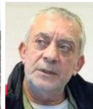
Fragapane: les Carrières ont déjà recours au chômage économique

travailleurs, avant une assemblée du personnel dans l'après-midi.