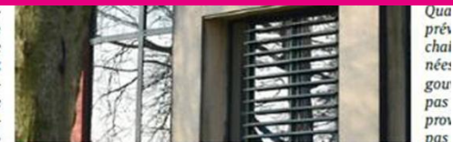
Ca s'annonce compliqué pour les CPAS...

dant d'une part à devoir gérer un plus grand nombre de dossiers avec la réforme du chômage et comptant d'autre part sur des aides financières du fédéral, le CPAS de Frameries a demandé au CRAC l'autorisation d'engager du person-