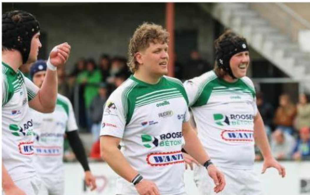
Les Carriers poursuivent leur folle saison.

À la pause, l'atmosphère restait positive malgré les difficultés rencontrées au niveau de la