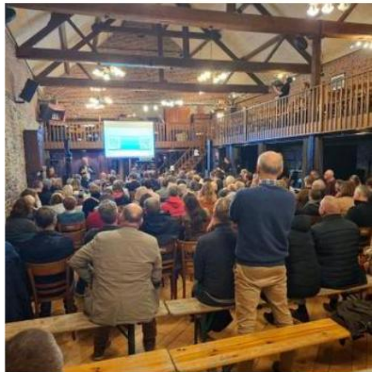
On espère que la conférence attirera du monde.

L'événement est accessible gratuitement, sur réservation obligatoire, auprès du service Culture par mail au culture@ecaussinnes.be ou par téléphone au 067/79.47.06. Il se tiendra à la Grange du Château, rue Georges Soupart 4 à Écaussinnes. ■