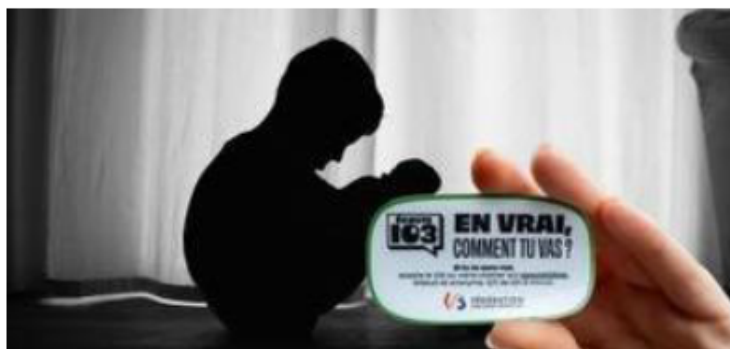
On peut appeler ou chatter avec le 103.