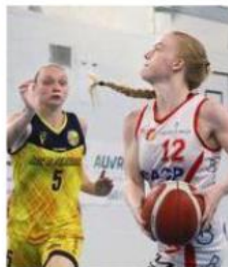
Il y aura du changement au sein des deux équipes du Centre.