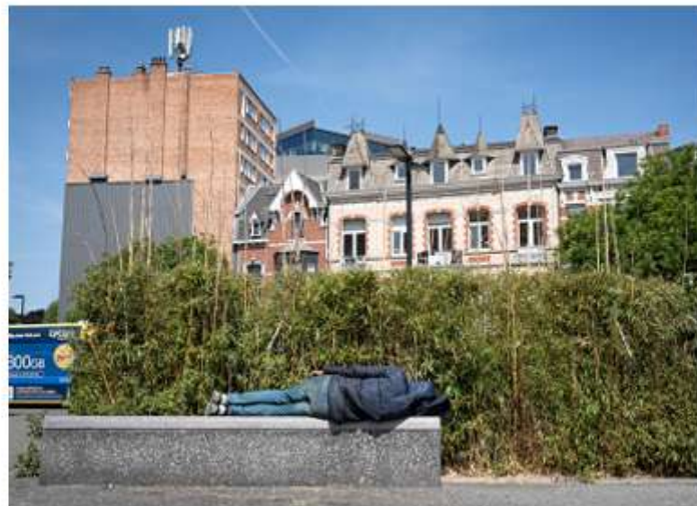
À Liège, Infirmiers de rue accompagne les sans-abri les plus précarisés.

Les derniers dénombrements, en octobre 2025, ont couvert le bassin liégeois et les arrondissements de Huy, Waremme, Tournai et Mouscron.