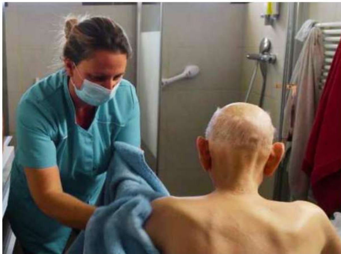
Les aides familiales, obligées de se décaler d'un bénéficiaire à l'autre, ne peuvent se passer de voiture.