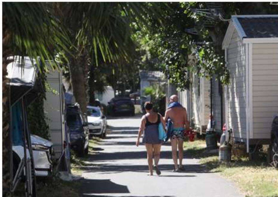
■ BooKamper gère 650 campings dans 18 pays européens.

La société pointe également des relations institutionnelles jugées troubles, évoquant une proximité entre certains acteurs, un accès inégal à l'information et une communication variable selon les interlocuteurs. Autant d'éléments qui alimentent les doutes quant à la neutralité du traitement du dossier.