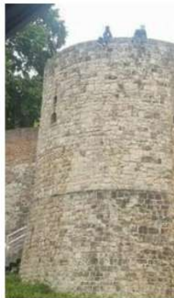
Ces deux jeunes gens prennent de très gros risques.