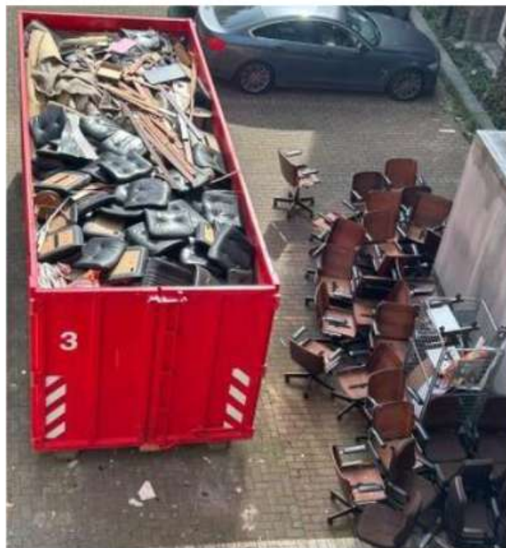
Pourquoi jeter ces chaises au lieu de les donner ou de les vendre ?

De notre côté, nous avons retrouvé, sur un site internet de seconde main consacré aux meubles vintage, la même chaise de bureau (ou quasi) avec dossier et assise en contreplaqué bois et coussins en cuir, datant des années 70, vendue au prix de 450 € pièce