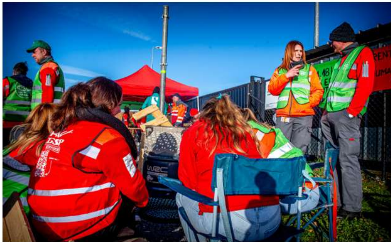
■ Le mouvement social met en lumière une transformation profonde du métier de facteur, entre inquiétudes des travailleurs et adaptation stratégique.