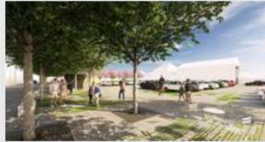
La place de Leval, plus verte avec une poche de parking voitures maintenue.

En 2021, la Ville de Binche a obtenu un subside de 756.800 € dans le cadre de l'appel à projets « Parcs en milieu urbanisé », soit 60 % du coût total estimé à 1.200.000 €. Ce financement s'inscrit dans une stratégie régionale visant à développer des espaces verts en milieu urbain et à limiter la minéralisation des places publiques.