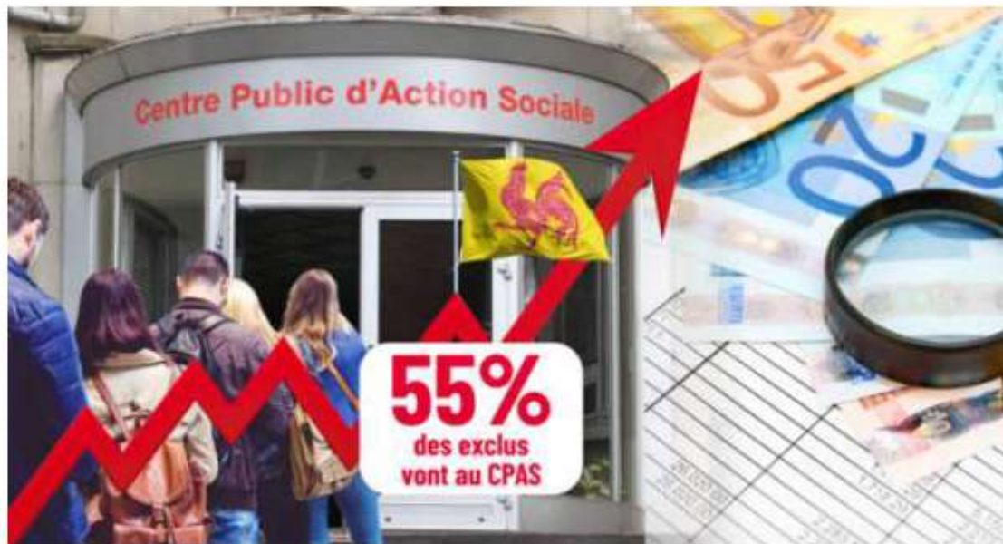
Des statistiques qui gonflent et qui inquiètent aussi les CPAS.

Les nouveaux chiffres du SPP Intégration sociale sont plus sombres. Fin mars, 47,9 % des chômeurs exclus en janvier et en février étaient « entrants au revenu d'intégration » au niveau national. Soit 38,1 % des exclus en Flandre, 41,5 % à Bruxelles et 55,4 % des chômeurs exclus en Wallonie. Des chiffres toujours pas définitifs (ils ne seront stabilisés que dans un mois), mais qui ne devraient plus trop fluctuer.