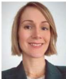
V. Kulawik évoque un périmètre de 28 kilomètres carrés.

Les mesures seront matérialisées par des panneaux d'interdiction C23 complétés par des signaux additionnels indiquant « +5T » et « excepté desserte locale ». « La présence de panneaux et des contrôles réguliers par la police sur l'ensemble du périmètre doivent agir comme facteur dissuasif pour les conducteurs de