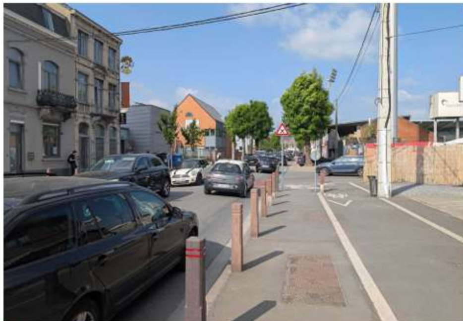
■ L'avenue du Tir, à Mons, va être rénovée.

Le projet prévoit une démolition complète de la chaussée existante afin de reconstruire une voirie à double sens large de six